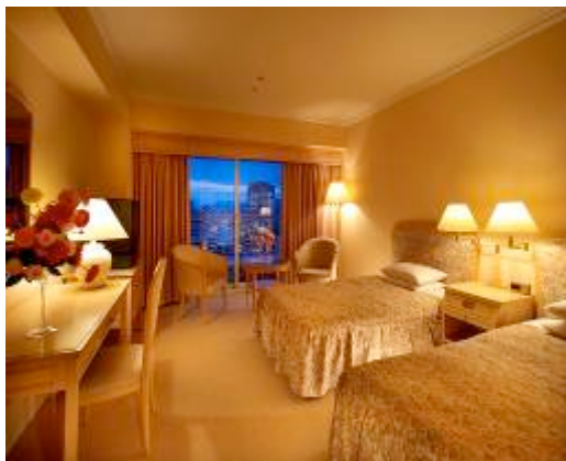
※スタンダードフロア(イメージ)