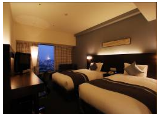
※スーペリアツイン(イメージ)