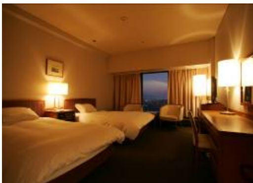
※スタンダードツイン(イメージ)